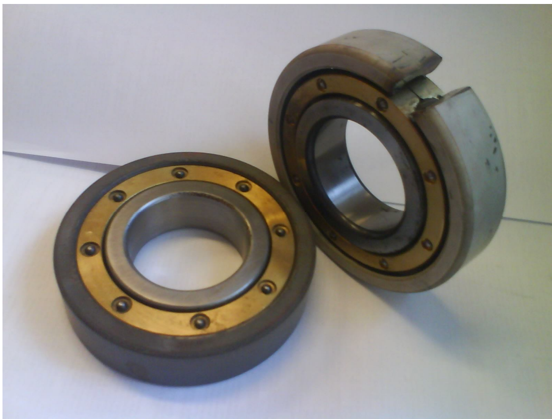
Рис. 2. Подшипники качения с керамическим покрытием, нанесенным на наружное кольцо

Представленная технология создания керамических покрытий найдет перспективное применение при напылении внешних колец подшипников, предназначенных для работы в электроустановках. Внешний вид описываемых деталей приведен на рис. 2.